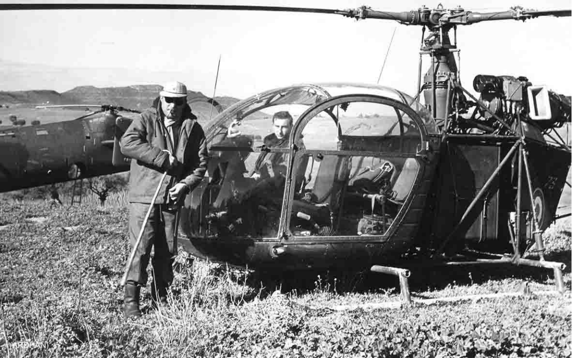
GHAN 1 – Le CC Babot et une Alouette de l'armée de l'Air