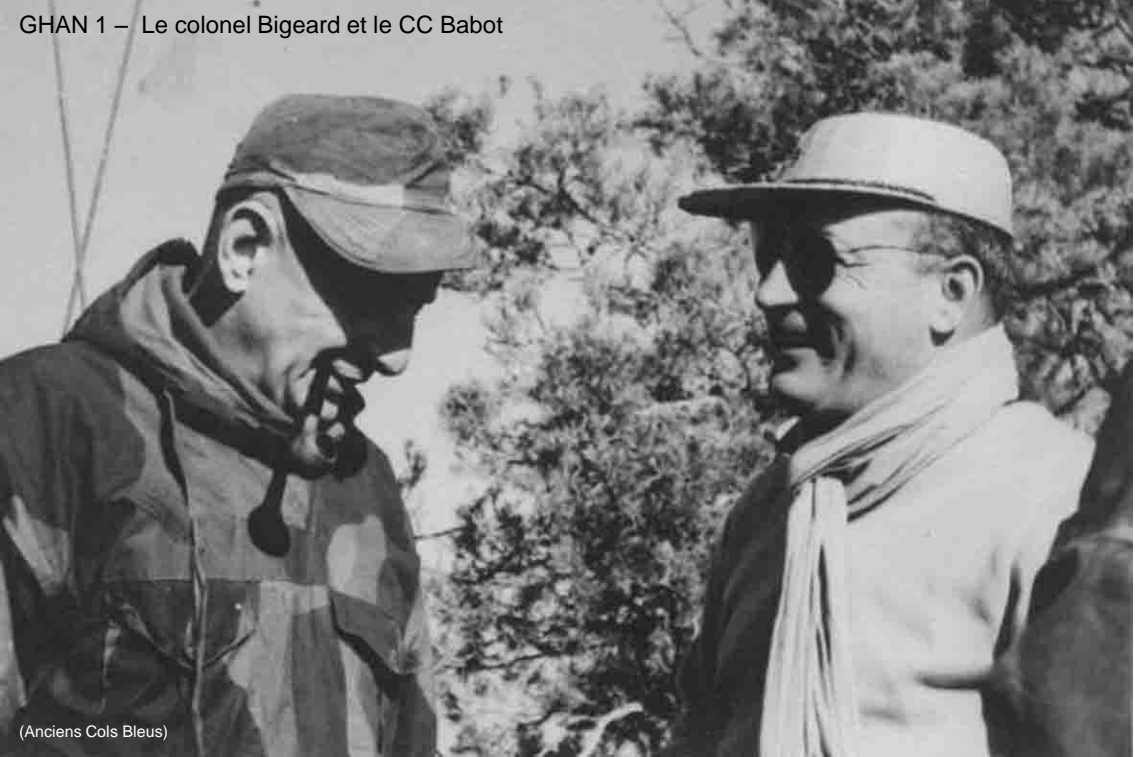
(Anciens Cols Bleus)