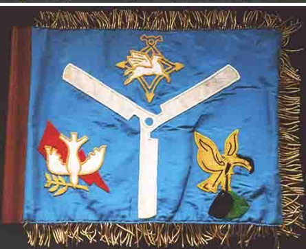
L'étendard du GHAN 1 rassemble les insignes des trois flottilles d'hélicoptères