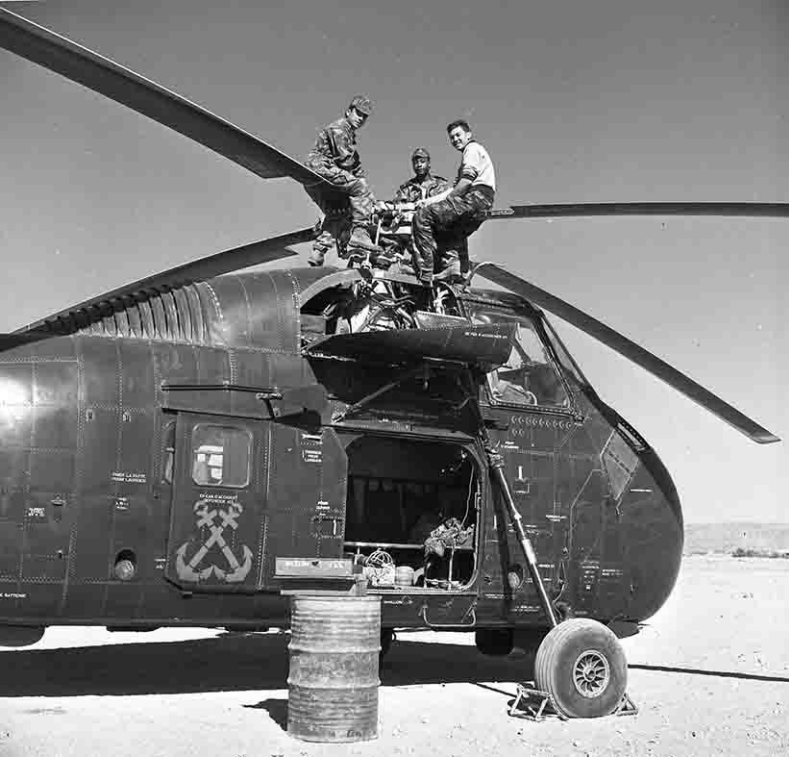
Entretien d'un HSS-1 du GHAN 1 en opération