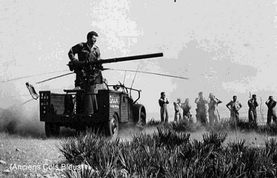
(Anciens Cols Bleus)