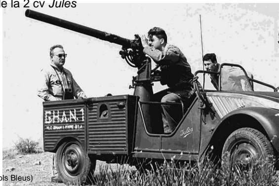
(Anciens Cols Bleus)