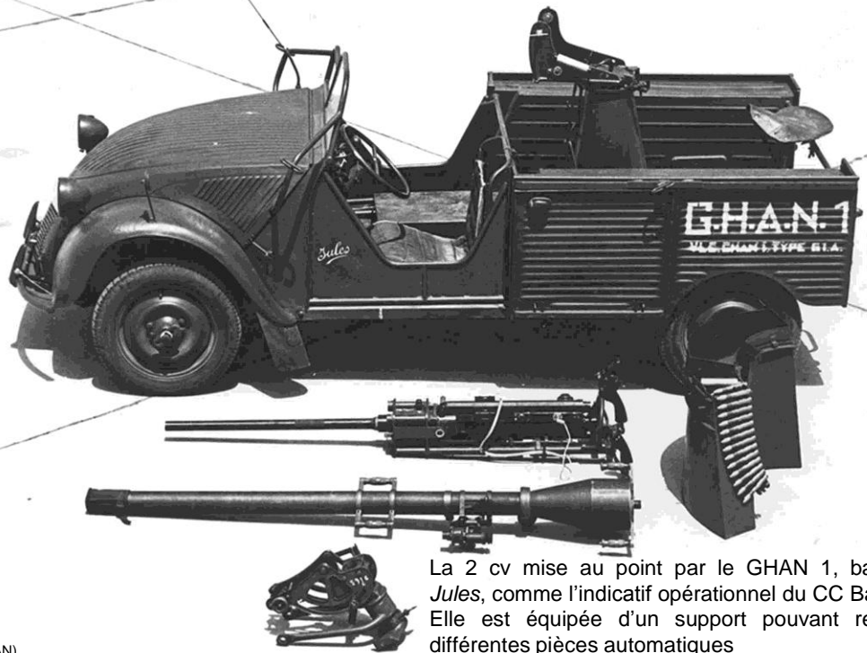
La 2 cv mise au point par le GHAN 1, baptisée Jules , comme l'indicatif opérationnel du CC Barbot – Elle est équipée d'un support pouvant recevoir différentes pièces automatiques