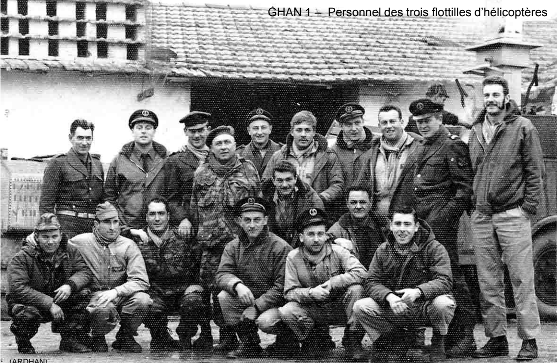
GHAN 1 – Personnel des trois flottilles d'hélicoptères