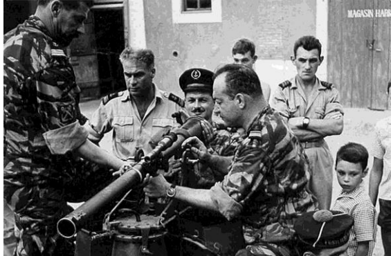
Mise au point de la 2 cv Jules