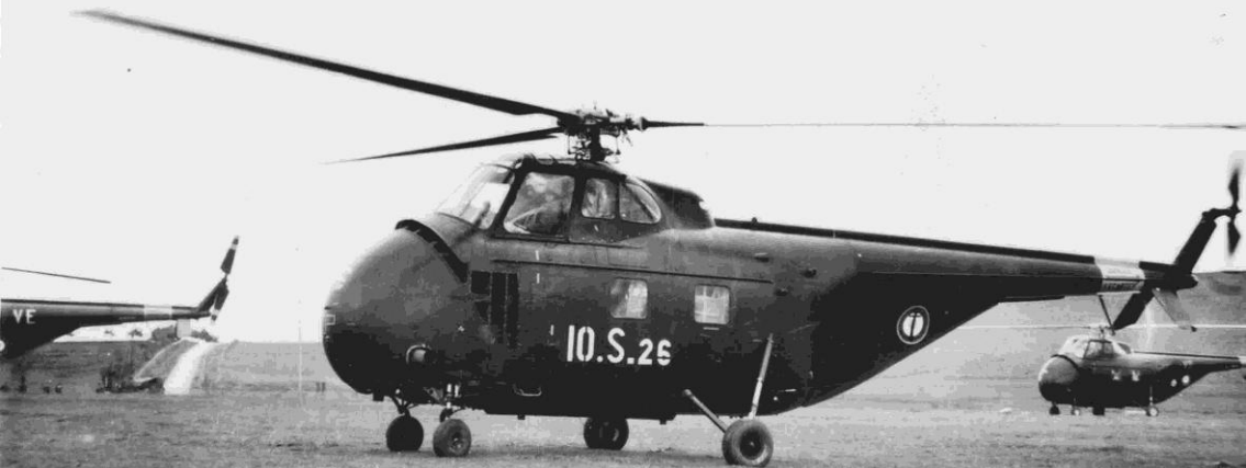
Région de Souk-Ahras, janvier 1956 – Le premier H-19 de la Marine en Algérie