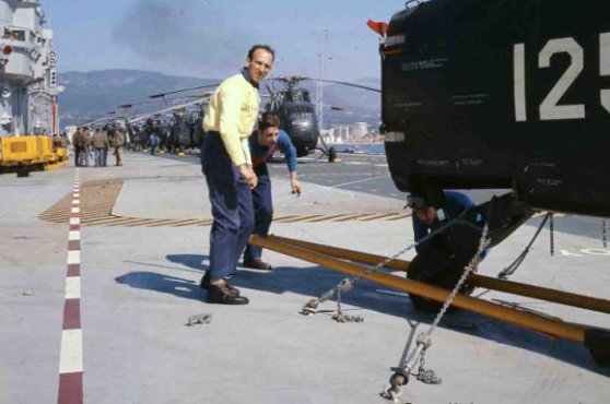
Sur l'Arromanches, en rade de Toulon