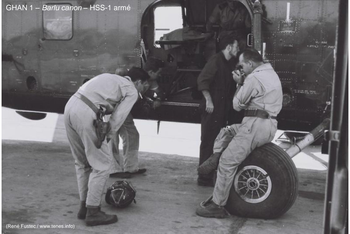
GHAN 1 – Barlu canon – HSS-1 armé